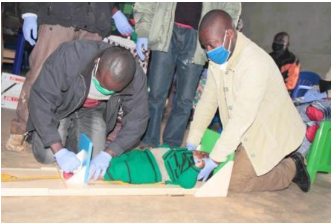
Photo sur exercice pratique de prise de la taille en respectant la PCI